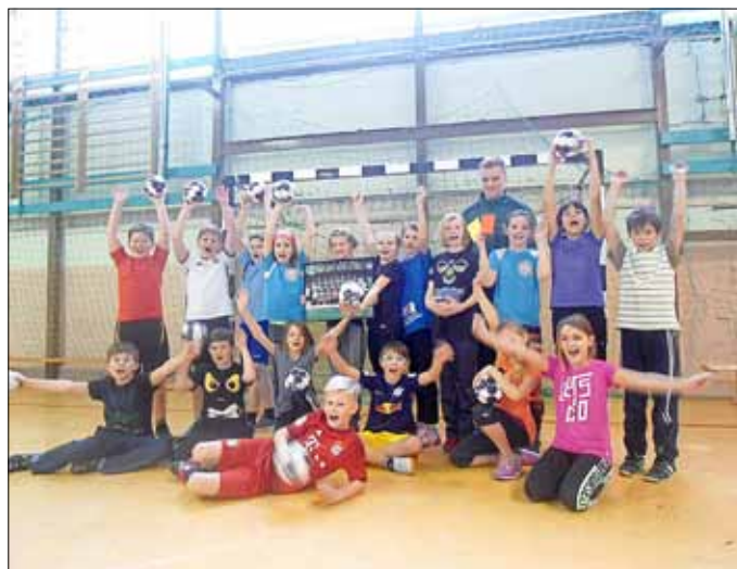
Handballtraining mit Vertretern des DHfK