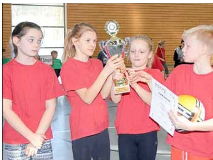
Hallensportfest in der Bundespolizei Bad Düben