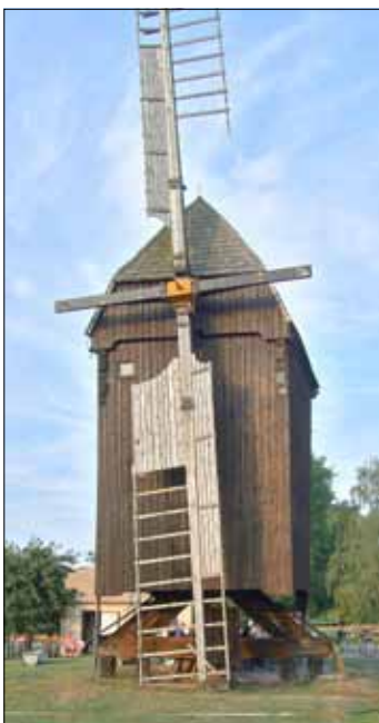
Der neue Anstrich