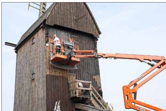
Die mutigen Helfer in luftiger Höhe