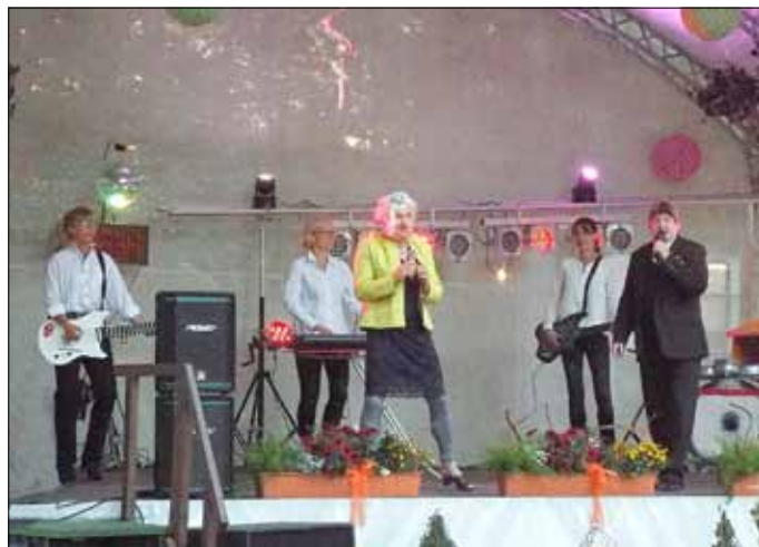
Auftritt der „Alten Herren“