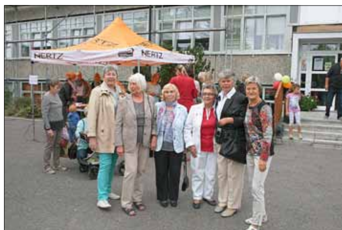
Wiedersehen ehemaliger und aktiver Lehrer