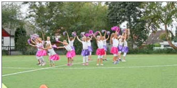
Die Löbnitzer Cheerleader in Aktion!