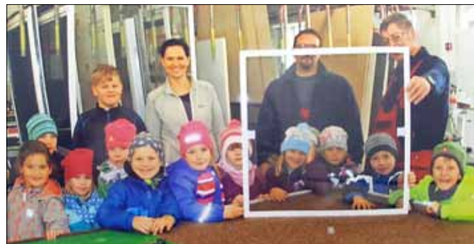
Unsere Vorschulkinder in der Firma Metallbau Süpple GmbH

Auch wenn wir nicht den ersten Platz erreichen sollten, konnten wir doch viel über die Löbnitzer Handwerker lernen und die Exkursionen in die Handwerksbetriebe werden uns noch lange in guter Erinnerung bleiben.