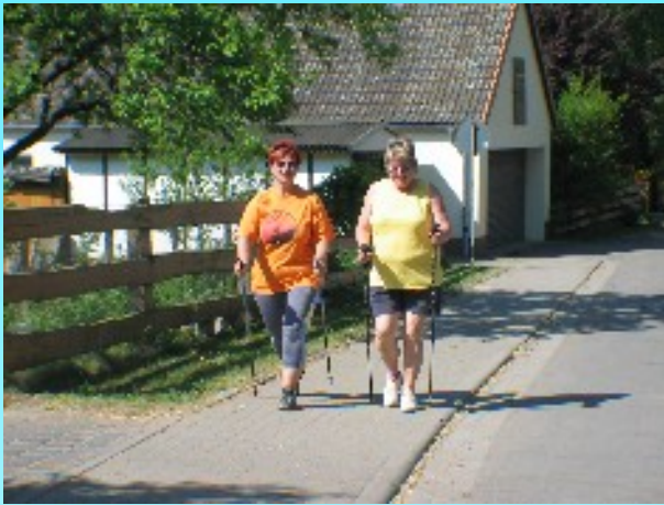
Nordic Walking durch die Dübener Heide

Es führen viele markierte Wanderwege vom Campingplatz in die Umgebung wie z. Bsp.: Radwanderwege rund um den Seelhausener See, in die Nähe der Goitzsche und des Muldestausees.