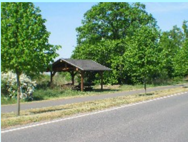
Radwanderwege rund um die Goitzsche

Der Ort Löbnitz ist nur einige hundert Meter entfernt, dort gibt es einen Konsum, Bäcker und Fleischer sowie verschiedene Gaststätten und Reithallen.