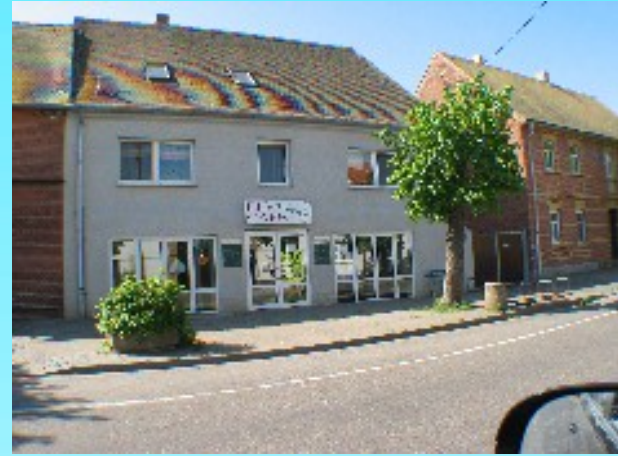
Eiscafe Sicilia in Löbnitz

Der Ort Löbnitz ist nur einige hundert Meter entfernt, dort gibt es einen Konsum, Bäcker und Fleischer sowie verschiedene Gaststätten und Reithallen.