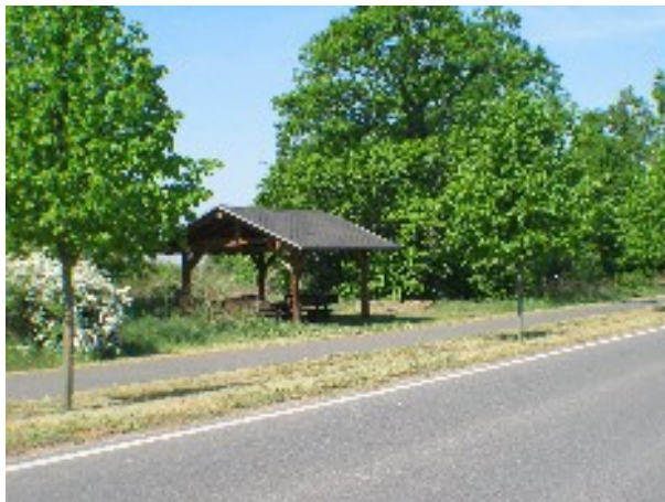
Radwanderwege rund um die Goitzsche

Der Ort Löbnitz ist nur einige hundert Meter entfernt, dort gibt es einen Konsum, Bäcker und Fleischer sowie verschiedene Gaststätten und Reithallen.