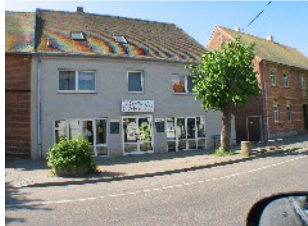
Eiscafe „Sicilia“ in Löbnitz

Der Ort Löbnitz ist nur einige hundert Meter entfernt, dort gibt es einen Konsum, Bäcker und Fleischer sowie verschiedene Gaststätten und Reithallen.