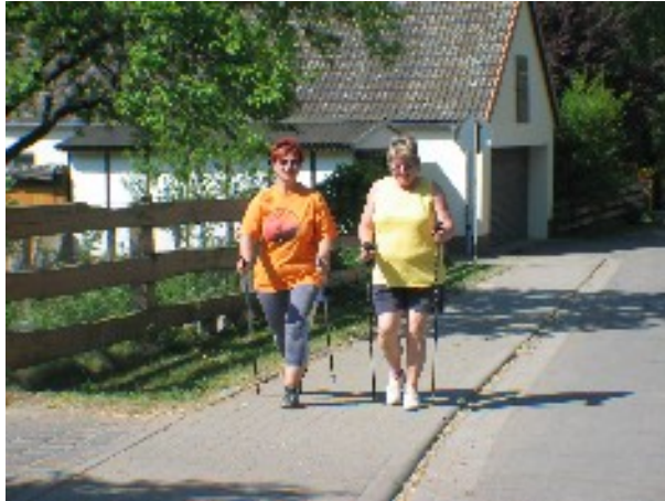
Nordic Walking durch die Dübener Heide

Es führen viele markierte Wanderwege vom Campingplatz in die Umgebung wie z. Bsp.: Radwanderwege rund um den Seelhausener See, in die Nähe der Goitzsche und des Muldestausees.