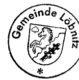
Axel Wohlschläger Bürgermeister