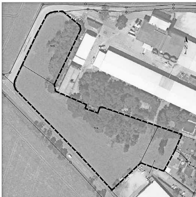
Geltungsbereich des vorzeitigen Bebauungsplans Nr.15 „Gewerbegebiet Sausedlitz, Luftpark“

Anlage: Übersichtsplan (nicht maßstäblich)