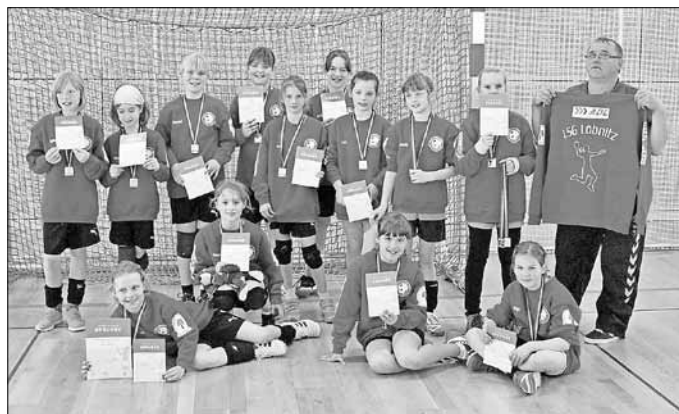
Siegerehrung der Sachsenmeisterschaft in Riesa