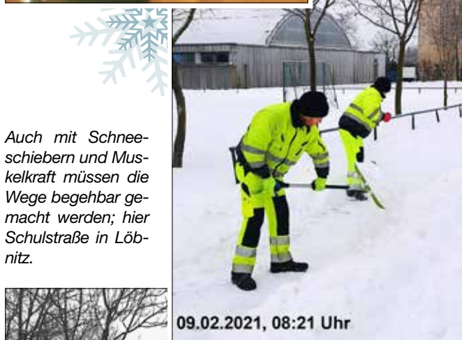
Auch mit Schneeschiebern und Muskelkraft müssen die Wege begehrbar gemacht werden; hier Schulstraße in Löbnitz.