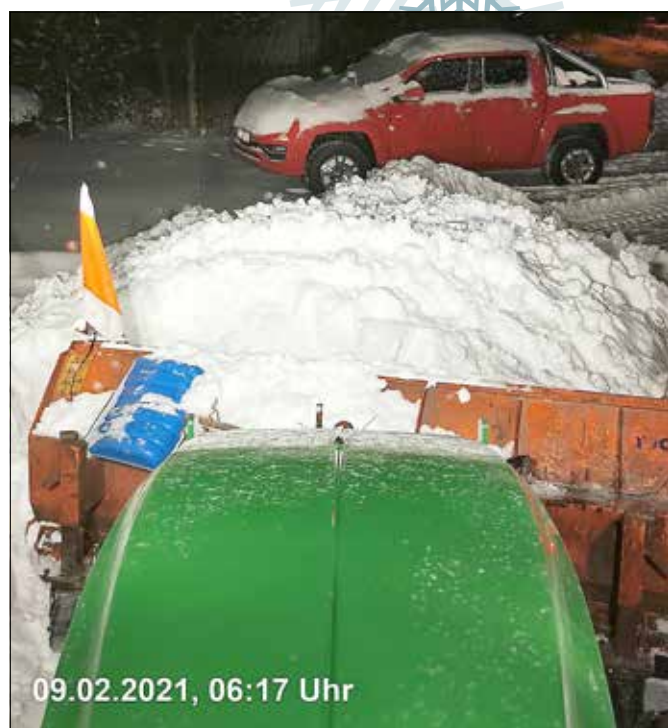
09.02.2021, 06:17 Uhr