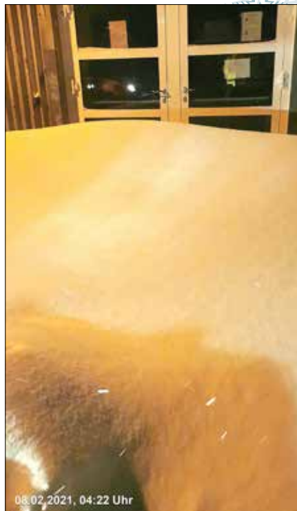
Ohne das Freischaufeln wäre das Betreten der Turnhalle in Löbnitz nicht möglich.