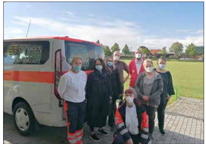
Das Impfteam im Mai zum 1. Impftermin

aus Taucha und Dr. Reiche aus Borna sowie dem medizinischen Fachpersonal der Kassenärztlichen Vereinigung.