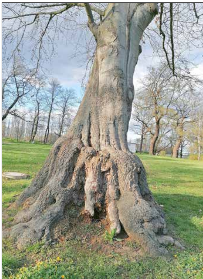
Baumschäden durch langjährigen Pilzbefall