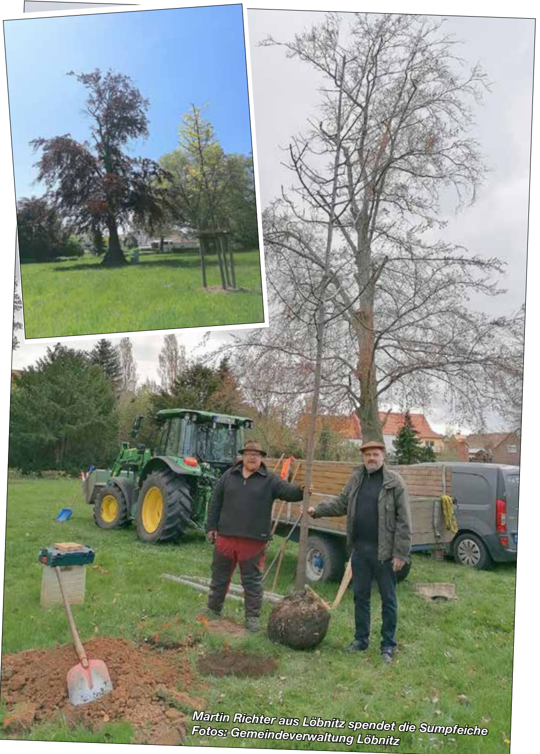
Martin Richter aus Löbnitz spendet die Sumpfeiche