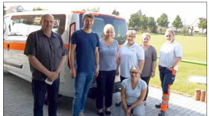
Das Impfteam im Juni zum 2. Impftermin

Zusätzlich zu unseren Impfterminen in Löbnitz stellte die Stadtverwaltung Bad Dübener weitere 50 Löbnitzer*innen am 18. Mai 2021 einen Impftermin im HeideSpa Bad Dübener bereit. Der Termin zur Zweitimpfung erfolgt am 15. Juni 2021 auch in Bad Dübener. Vielen Dank an die Stadtverwaltung Bad Dübener und das mobile Impfteam der Bundeswehr.