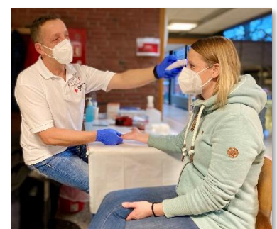
DRK-Blutspende unter Pandemiebedingungen. Hier: Messung des HB-Wertes vor der Blutentnahme; Foto: ©DRK-Blutspendedienst; Nutzung honorarfrei

Wer sich für das Blutspenden beim DRK interessiert, sollte unbedingt mal reinklicken. Außerdem ist eine Terminreservierung für alle DRK-Blutspende-Termine erforderlich. Sie kann unter https://terminreservierung.blutspende-nordost.de/ erfolgen oder auch über die kostenlose Hotline 0800 11 949 11. Die Vorab-Buchung von festen Spendezeiten dient dem reibungslosen Ablauf unter Einhaltung aller aktuell geltenden Hygiene- und Abstandsregeln.