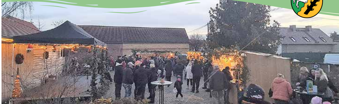
19. Adventsmarkt in Löbnitz