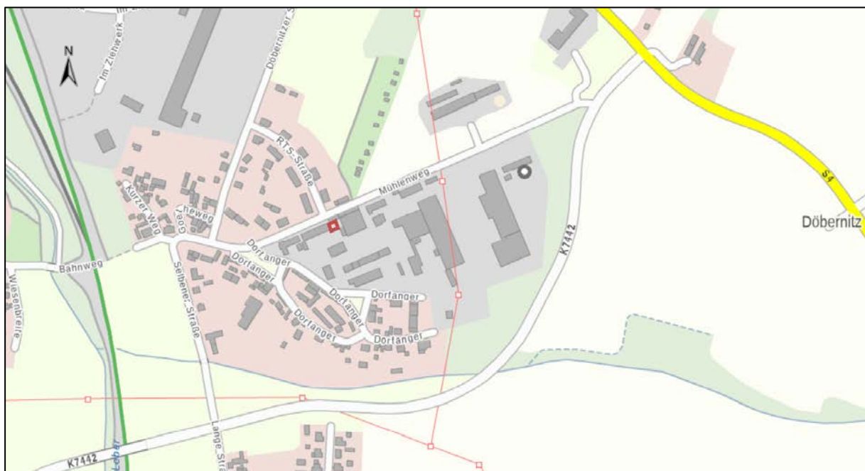
Abb. 3: Lage des externen Kompensationsmaßnahme M 3 in der Stadt Delitzsch (Kartenauszug aus RAPIS vom 08.11.2021)