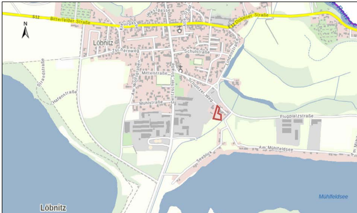
Abb. 2: Lage des Geltungsbereichs (Kartenauszug aus RAPIS vom 08.11.2021)