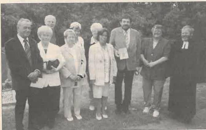
Die Teilnehmerinnen und Teilnehmer der „Goldenen Konfirmation Reibitz“

Die Gemeinde wird das Geld für Blumenschmuck in der Kriegsgräberanlage verwenden.