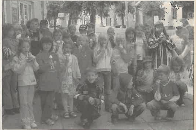
Bei den 40 Kindern im Schulhort ist ein leckeres, erfrischendes Eis immer beliebt.

Am Ehrentag selbst spendierte unsere Bürgermeisterin den 40 Kindern des Schulhortes ein leckeres Eis, denn mit solch einer kühlen Erfrischung kann man die lieben Kleinen zu jeder Zeit erfreuen.