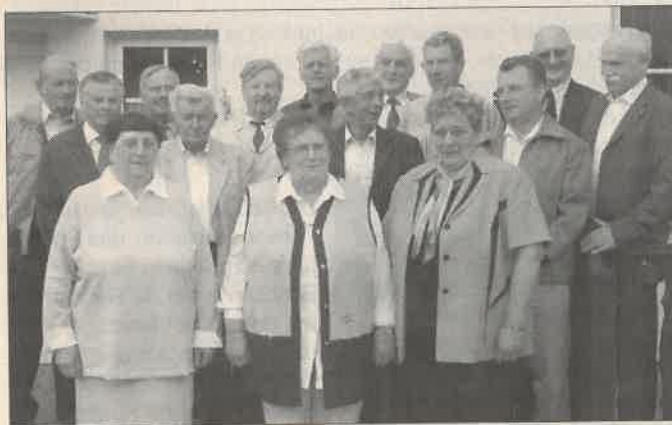
Die Teilnehmer der „Goldenen Konfirmation“ in Löbnitz