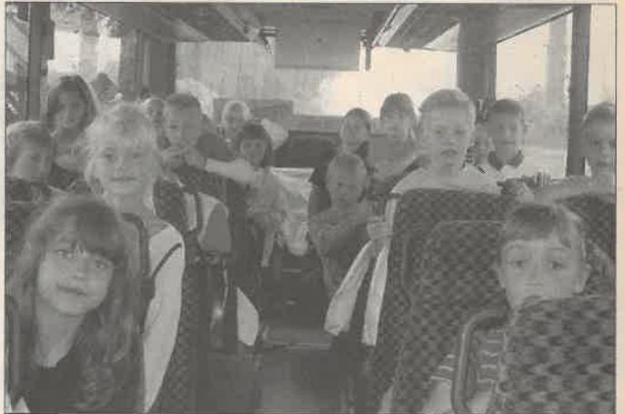
Bei Antritt der langen Busreise waren die Kinder der 1. Klasse besonders aufgeregt.