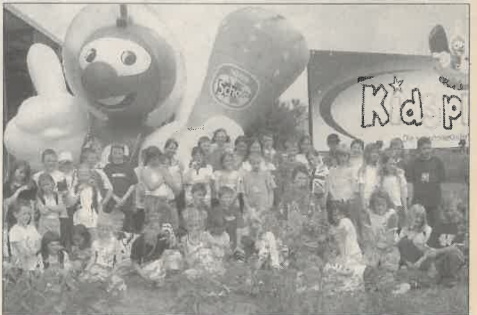
Alle Grundschüler vor dem Eingang der Spielhalle „Kidsplanet“

Eine riesengroße Spielhalle in der Landeshauptstadt Dresden war unser Ziel.