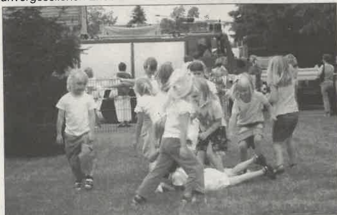
Eine Fahrt mit der Feuerwehr.

Den Mitarbeitern des Kinderhauses ist es ein Bedürfnis, allen sichtbaren und unsichtbaren Helfern zu danken, die das Fest zu einem unvergesslichen Erlebnis für alle werden ließen.