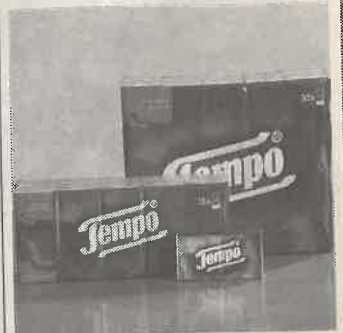
Tempo-Taschentücher: Im Notfall stark genug für ein zweites Mal!

Winterzeit ist Schnupfenzeit! Daran können wir leider nichts ändern. Wen es aber erwischt hat, der kann einiges tun, um schnell wieder fit zu werden. Tägliche Spaziergänge, viel Obst und Gemüse, eine ausgewogene