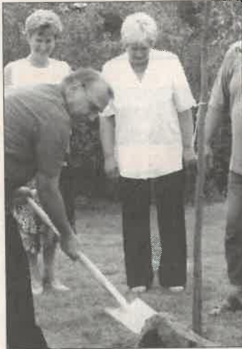
Eine Esche wird auf dem Spielplatzgelände gepflanzt.