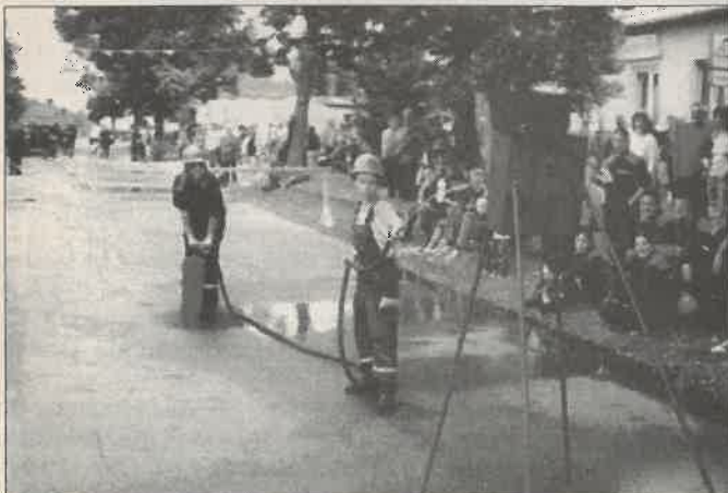
Viele der wiederum ca. 600 Gäste freuen sich schon auf das nächste "Fest der Gemütlichkeit und kleinen Preise".