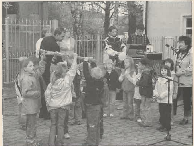
Ein Lied über die Sonne tragen die Kleinen von der Kita vor.