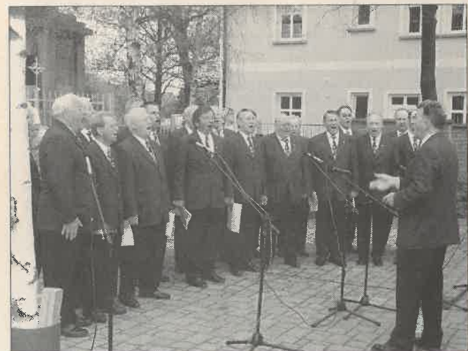
Kräftige und geschulte Männerstimmen erschallen und singen den Frühling herbei.