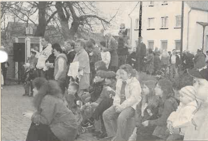
Wie jedes Jahr füllte sich der Löbnitzer Dorfplatz innerhalb von wenigen Minuten anlässlich des traditionellen Maibaumsetzens.