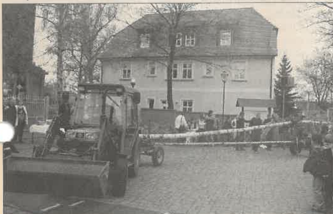
Punkt 18.00 Uhr stand (lag) der geschmückte Baum parat.