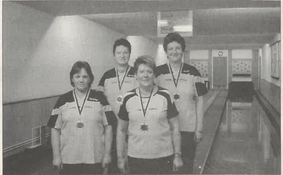
Vize-Bezirksmeister der Seniorinnen vorgestellt

FSV Bad Düben 1080 Kegel - Spg. Delitzsch/Kyhna 973 Kegel