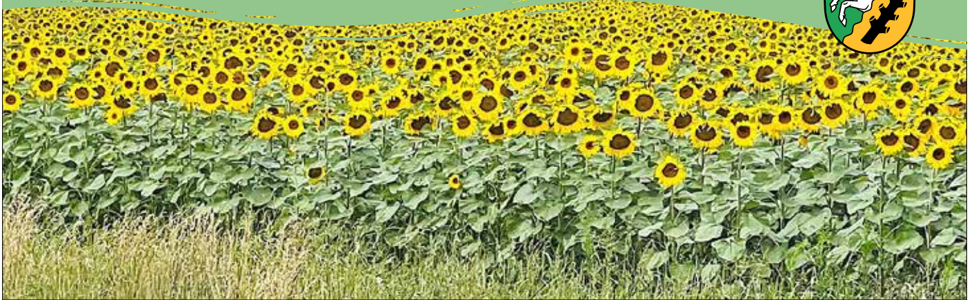
Ein Sonnenblumenmeer am Muldetalarm „Gelbes Wasser“ in Löbnitz