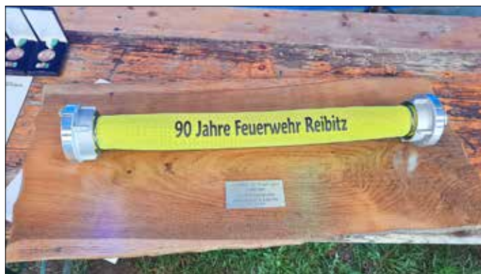
Gastgeschenk von der Ortsfeuerwehr Löbnitz