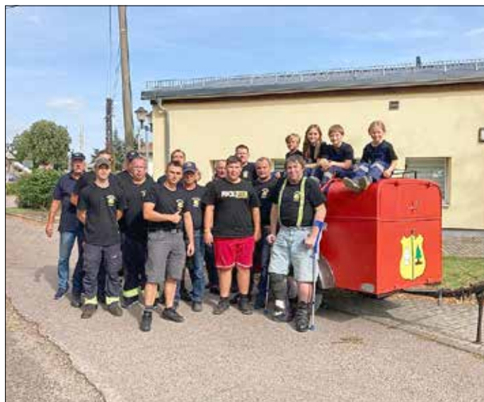
Reibitzer Feuerwehrkameraden mit Teil der Jugendfeuerwehr Reibitz