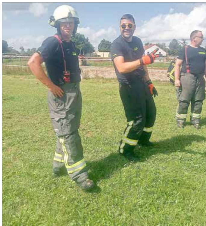
Gute Laune und jede Menge Spaß