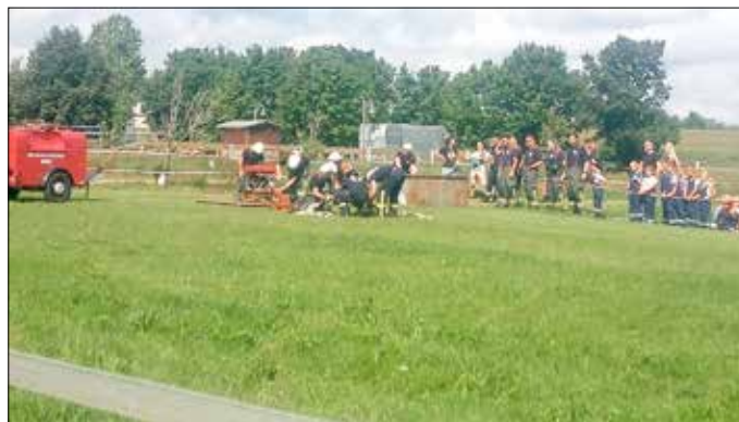
Wettkampf „Löschangriff“ FFW Reibitz