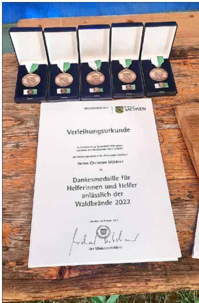
Waldbrandmedaille 2022 des Ministerpräsidenten von Sachsen