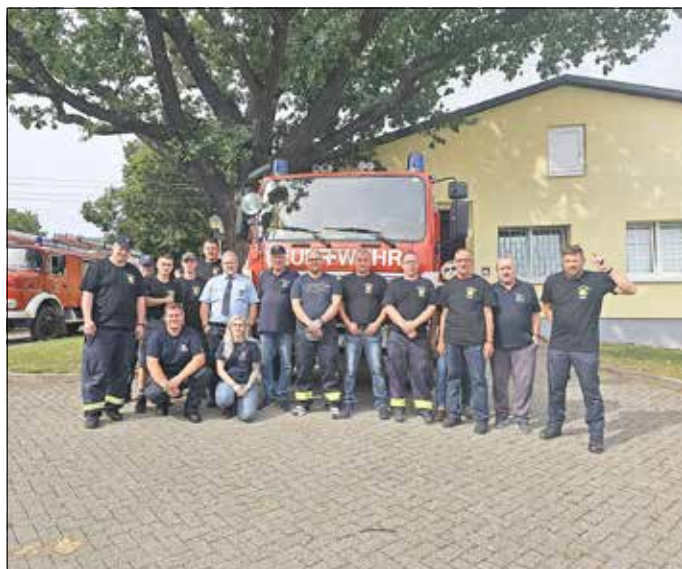
FFW Reibitz mit FFW Brachstedt (Gemeinde Petersberg)