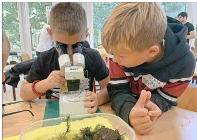
Unter dem Mikroskop werden einige gefundene Wasserlebewesen genauer angeschaut. Neben verschiedenen Libellenlarven-Stadien werden auch Wasserfloh, Eintagsfliegenlarve, Ruderwanze und Wasserläufer beobachtet.