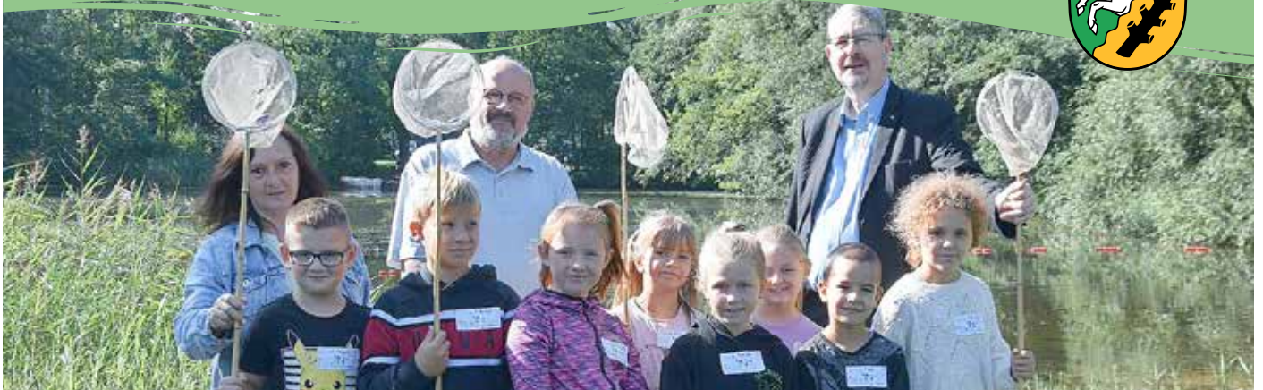
14. Auflage von „Natur zum Anfassen“ im Schullandheim Reibitz