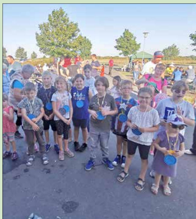
Siegerehrung, Kinder mit Medaillen