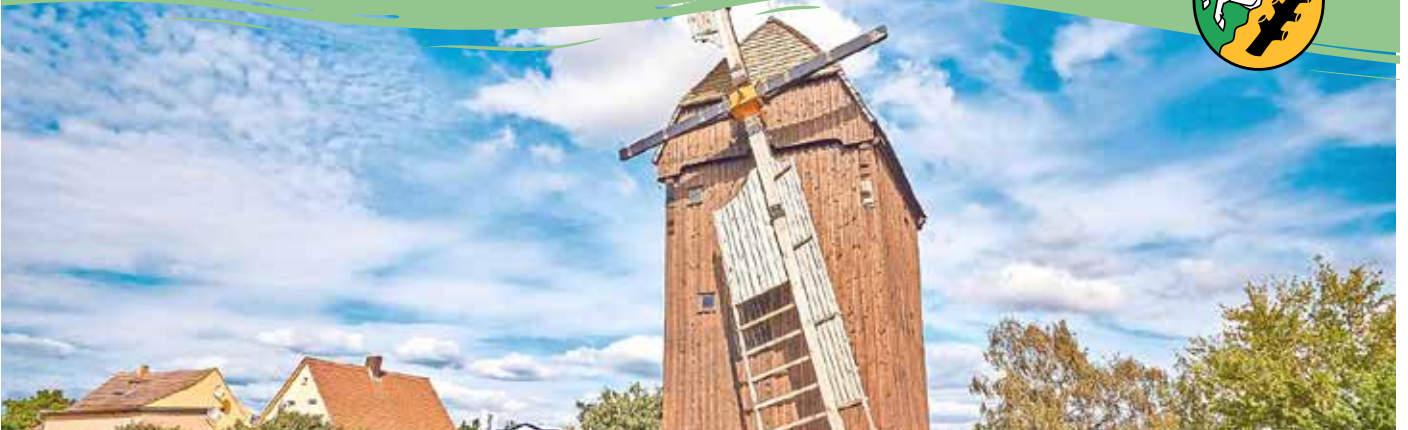
Bockwindmühle „Döbler“ 1760 in der Delitzscher Straße in Löbnitz