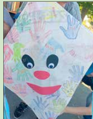
Selbstgebastelter Drachen der Hortkinder aus Löbnitz