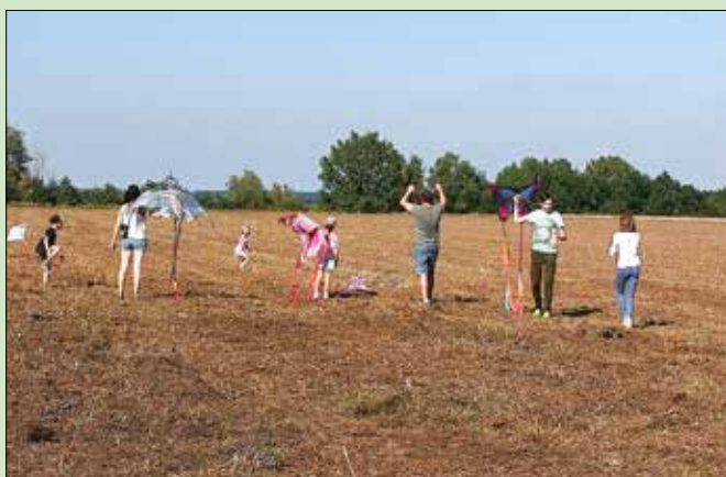
Drachensteigen auf dem Feld