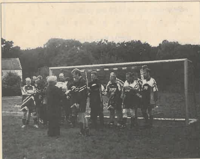
Auch Bürgermeister Prautzsch gratulierte den Fußballfreunden zu diesem freudigen Ereignis.

Dies bedeutet neuen Bahnrekord auf der Bahn III und IV. Alle Mannschaften spielten sehr gute Ergebnisse, es wurden 12 x über 400 Kegel gespielt. Leider konnte der Pokalverteidiger Radefeld nicht mit der stärksten Mannschaft anreisen, es fand noch ein Spiel in Radefeld statt.