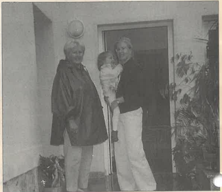
Auch die Bürgermeisterin gratulierte zur Eröffnung des Studios und gab ihrer Zuversicht Ausdruck, dass nun viele Damen unserer Gemeinde noch attraktiver werden.

Es wird also kaum unnötige Wartezeiten geben. Ein freundlich eingerichtetes Studio steht bereit, jeden nach seinen Wünschen zu pflegen und zu verschönern. Auch Parkmöglichkeiten sind für die Kundschaft vorhanden. Wer sich also etwas Gutes tun will, hat eine neue Adresse für gepflegtes Aussehen.