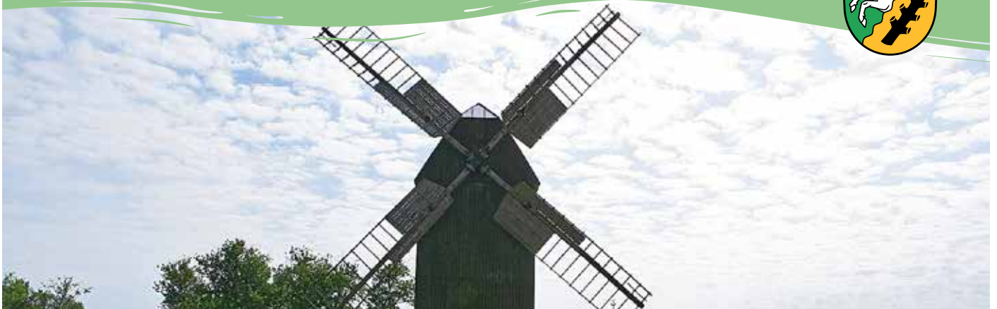
Führungen durch die Mühlen in Löbnitz und Reibitz, s. S. 6 (Dt. Mühlentag '23 Werbeliner Bockwindmühle Reibitz)

» Besuchen Sie uns auf www.loebnitz-am-see.de