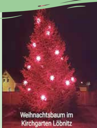
Weihnachtsbaum im Kirchgarten Löbnitz