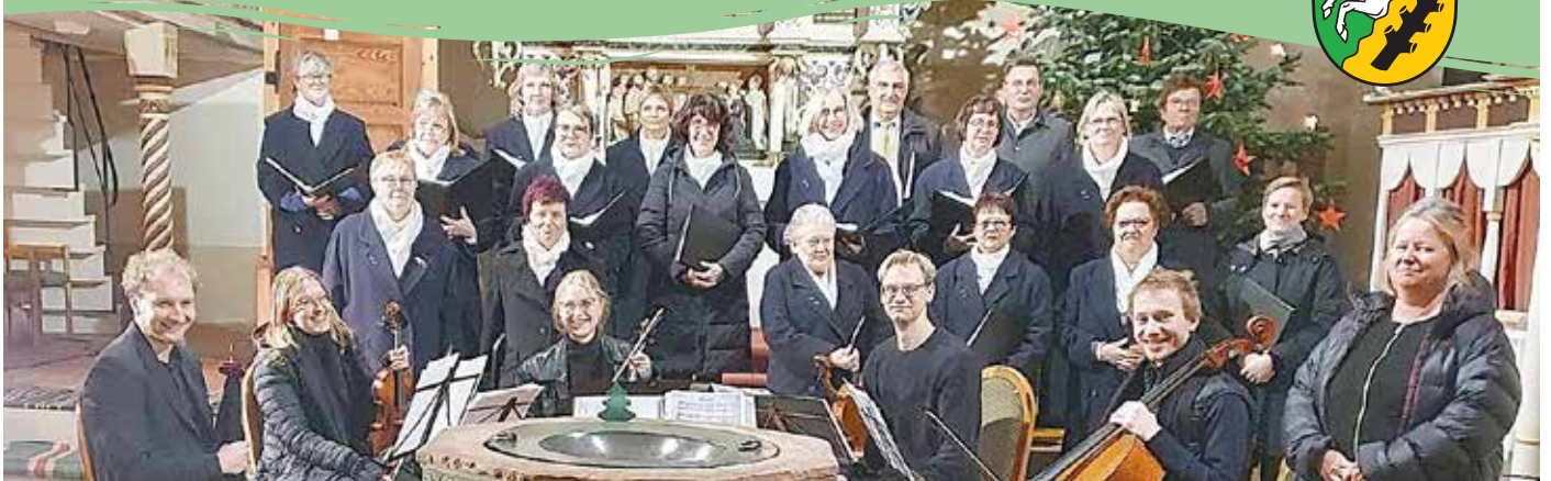
30. Adventskonzert der Kantorei Löbnitz e.V. in der evangelischen Kirche