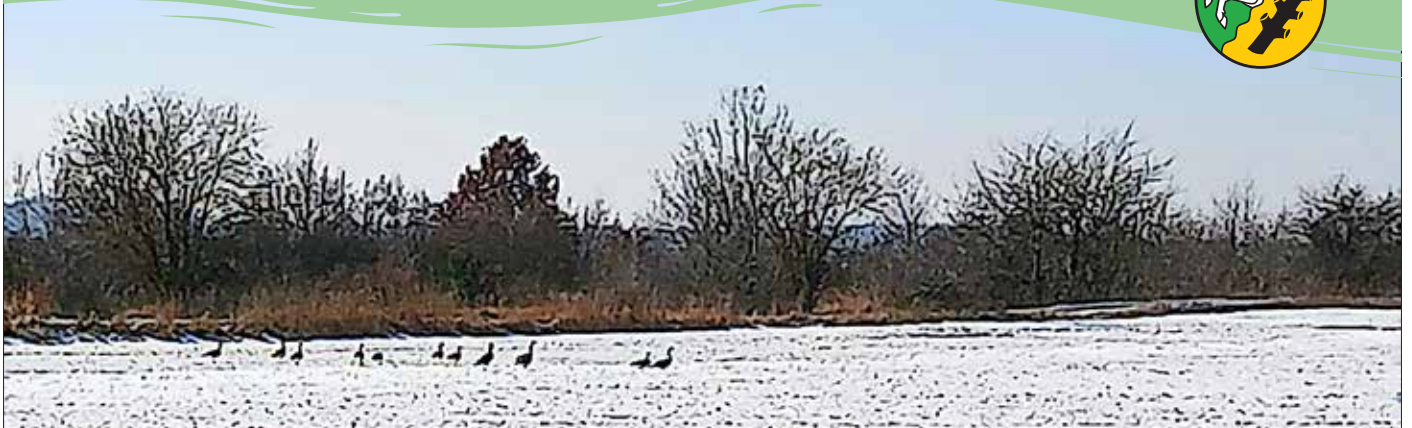
Winter in Löbnitz

» Besuchen Sie uns auf www.loebnitz-am-see.de