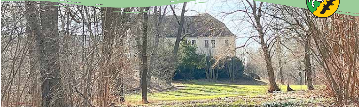
Boten des Frühlings - Schneeglöckchen im Schlosspark am Seniorenpflegeheim in Löbnitz