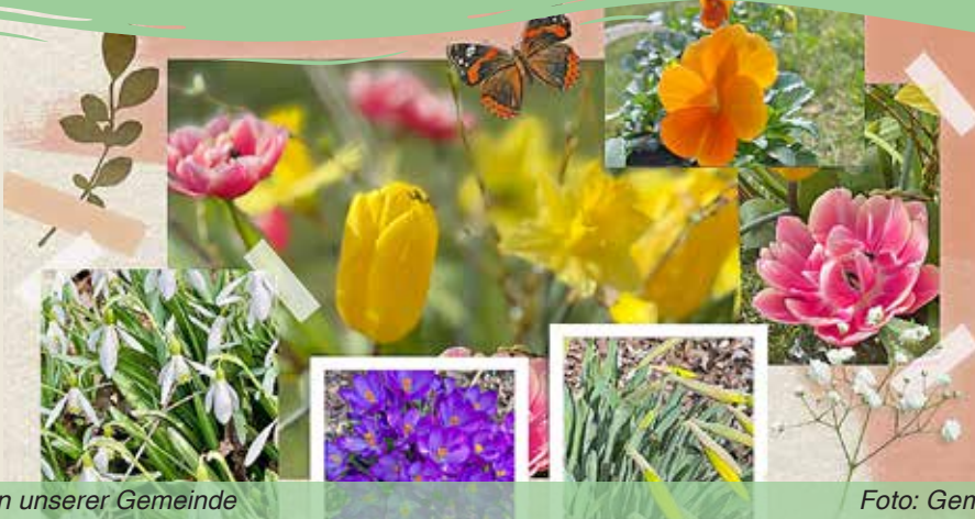
Frühlingserwachen in unserer Gemeinde